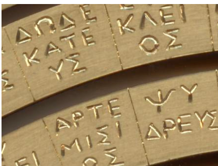
Détail du calendrier de Méton (haut du Cadran arrière)